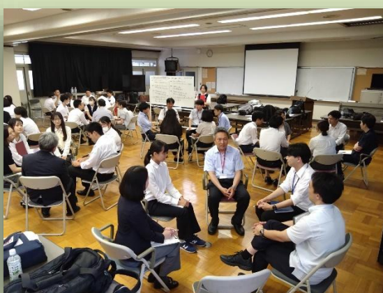
研究発表・研究協議の様子