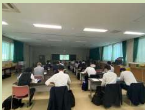
研究発表・研究協議の様子