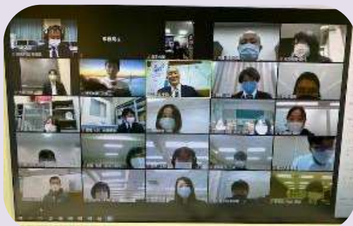
研究発表の様子 （令和3年度 オンライン形式）

※新型コロナウイルス感染症の拡大防止の措置を講じた上で、対面形式を予定しております。 ※当日は、マスクの着用・検温・手指消毒等の感染拡大防止にご協力ください。 ※新型コロナウイルス感染症拡大の状況によっては、オンラインでの協議会 （Teams もしくは Zoom を使用予定）へ変更して開催する場合があります。 変更の際は、参加方法を別途お知らせいたします。