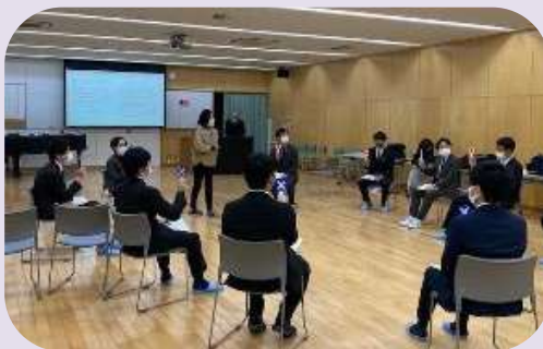
研究協議の様子 （令和3年度 対面形式）