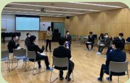
研究協議の様子 （令和3年度 対面形式）