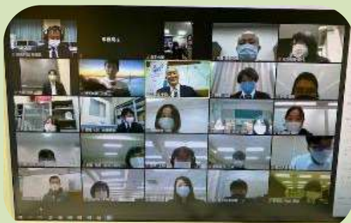
研究発表の様子 （令和3年度 オンライン形式）

※新型コロナウイルス感染症の拡大防止の措置を講じた上で、対面形式を予定しております。 ※当日は、マスクの着用・検温・手指消毒等の感染拡大防止にご協力ください。 ※新型コロナウイルス感染症拡大の状況によっては、オンラインでの協議会（TeamsもしくはZoomを使用予定）へ変更して開催する場合があります。 変更の際は、参加方法を別途お知らせいたします。