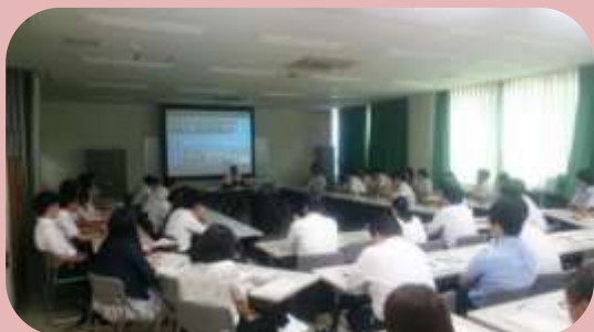
研究発表の様子（令和元年度）