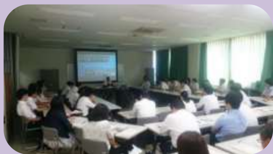
研究発表の様子（令和元年度）