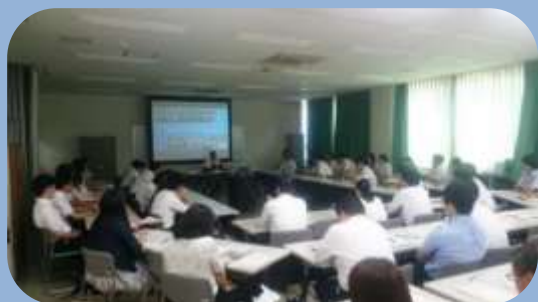
研究発表の様子（令和元年度）